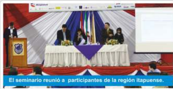
El seminario reunió a participantes de la región itapuese.