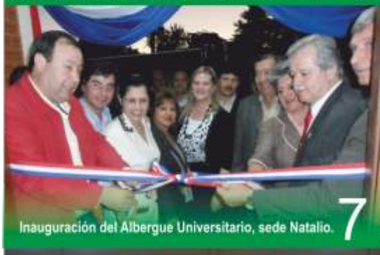
Inauguración del Albergue Universitario, sede Natalio.