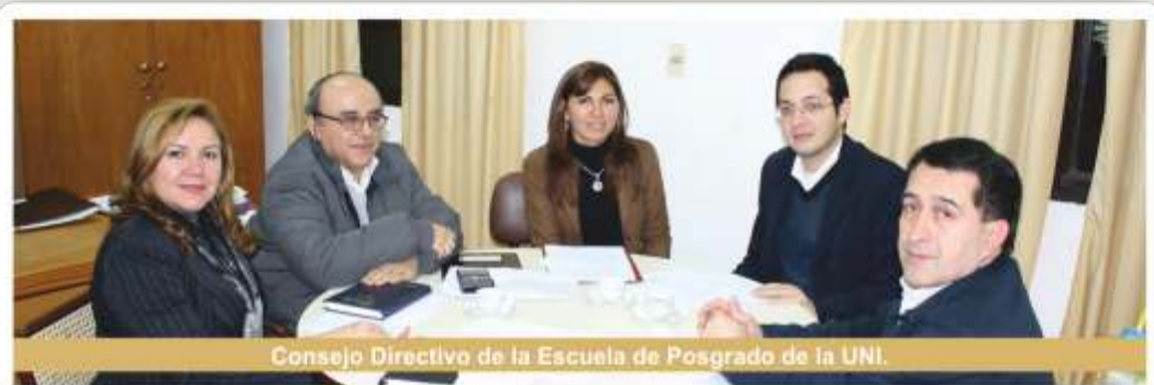
Consejo Directivo de la Escuela de Posgrado de la UNI.

Las diferentes ofertas y cursos que lleva adelante anualmente la Escuela de Posgrado de la UNI, permiten a los cursantes desenvolver la capacidad de investigación y desarrollo sobre la base de una sólida formación multidisciplinaria, para el ejercicio académico o profesional del más alto nivel, en ese sentido, continúa avanzando los diversos cursos que propicia en el presente año lectivo, la Especialización en Docencia Universitaria. Así también el Curso de Especialización en Investigación Científica del Delito; Maestría en Planificación Estratégica del Desarrollo Nacional. Este último en etapa de culminación con elaboración de tesis.