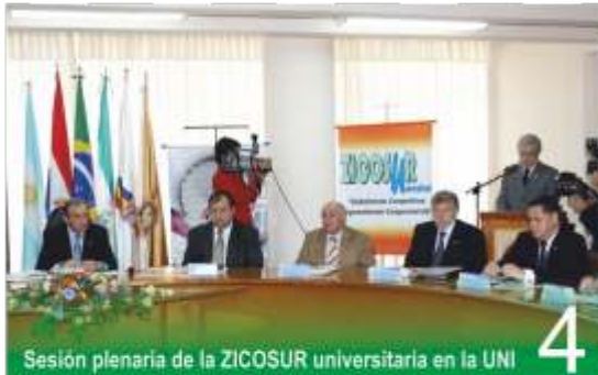
Sesión plenaria de la ZICOSUR universitaria en la UNI