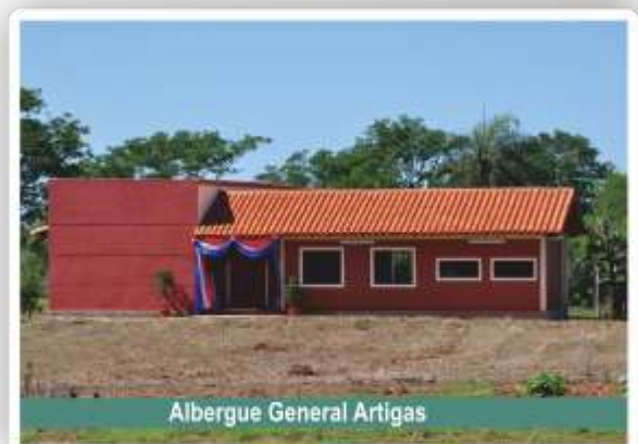
Albergue General Artigas

La ceremonia, realizada en el acceso principal de la Sede, registró la participación numerosos pobladores de la región, autoridades locales, estudiantes de los diferentes niveles de la educación, familiares y representantes de los diversos medios de comunicación departamental.