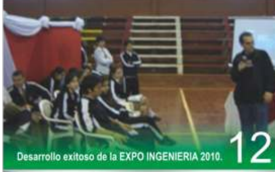
Desarrollo exitoso de la EXPO INGENIERIA 2010.