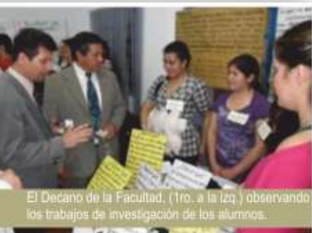
El Decano de la Facultad, (Tro. a la Izq.) observando los trabajos de investigación de los alumnos.