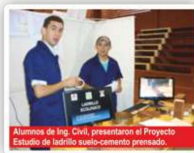
Alumnos de Ing. Civil, presentaron el Proyecto Estudio de ladrillo suelo-cemento prensado.

La Expo concluyó con éxito el día viernes 08 de octubre, los organizadores se mostraron satisfechos de haber recibido la visita de numerosos alumnos y docentes de la educación media, además de diferentes medios de prensa que difundieron el evento.