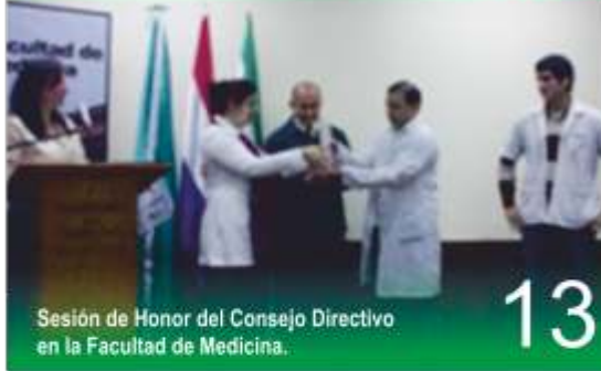
Sesión de Honor del Consejo Directivo en la Facultad de Medicina.