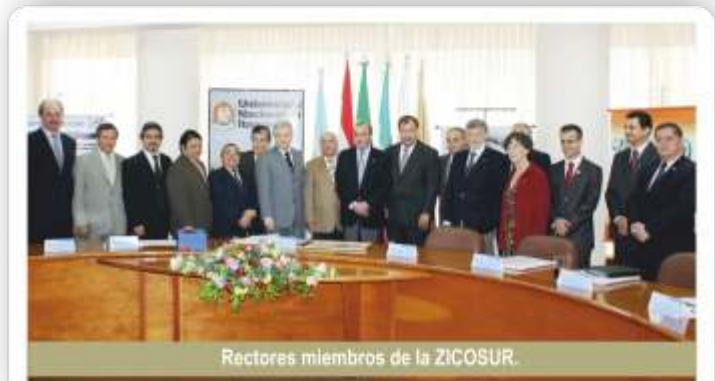
Rectores miembros de la ZICOSUR.