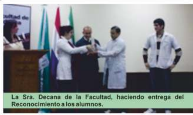
La Sra. Decana de la Facultad, haciendo entrega del Reconocimiento a los alumnos.

En el salón Auditorio de la Facultad de Medicina, el 14 de octubre, se llevó a cabo la Sesión de Honor del Consejo Directivo de esta Unidad Académica, teniendo como único punto del día el "Reconocimiento a los Estudiantes de la Facultad de Medicina, Campeones de la 10ª edición de las UNImpiadas 2010".