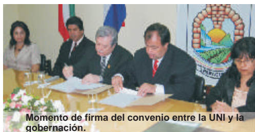
Momento de firma del convenio entre la UNI y la gobernación.

L os documentos suscriptos entre la Gobernación de Itapúa y la UNI fueron: 1) Convenio Marco de Cooperación Técnico Científico Cultural y de Servicios Generales con vigencia de 5 años; 2) Addenda N° 1, Convenio Marco de Cooperación Técnico Científico Cultural y de Servicios Generales,