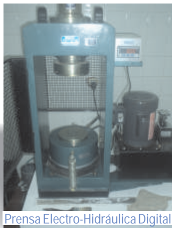
Prensa Electro-Hidráulica Digital

Dimensiones : (L) 700 x (A) 870 x (P) 280 mm. Peso aproximado : 700 kg Potencia : ¾ HP - 560 W Capacidad máxima de fuerza : 150 ton = 150.000 kg