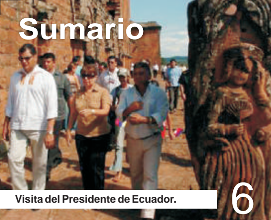
Visita del Presidente de Ecuador.