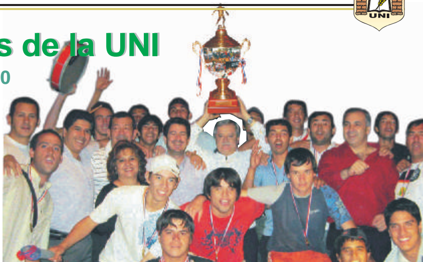
En la foto central El Rector quien estimó y apoyó la participación de la UNI en los primeros juegos universitarios del Paraguay, eleva la copa de "campeón".

La Universidad Nacional de Itapúa, con la obtención del título de Campeón y los tres lugares de privilegio en las disciplinas de vóley femenino, vóley masculino y fútbol de salón femenino, en el Campeonato Universitario organizado por la ANDUP, ha logrado posicionarse en un lugar trascendental a nivel deportivo. Posición que además del orgullo que representa, nos compromete a seguir mejorando el nivel de competencia de nuestros atletas, que representarán a la UNI en encuentros deportivos similares.