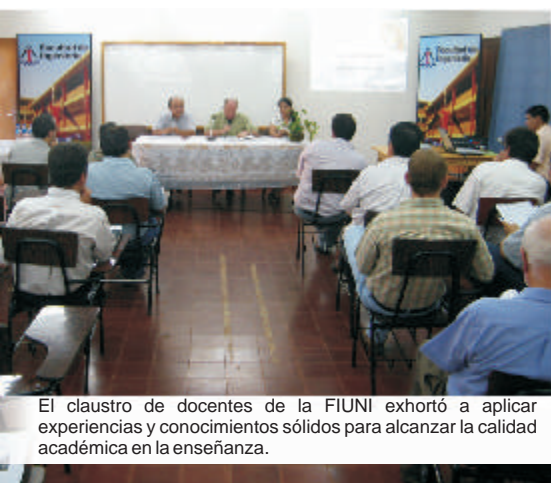
El claustro de docentes de la FIUNI exhortó a aplicar experiencias y conocimientos sólidos para alcanzar la calidad académica en la enseñanza.

Una de las actividades tradicionales en las diversas Unidades Académicas se llevó a cabo en la Facultad de Ingeniería (FIUNI). Esta marcó el inicio propiamente dicho de las actividades oficiales: El Claustro de Docentes.