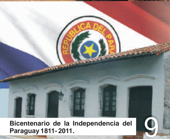
Bicentenario de la Independencia del Paraguay 1811-2011.