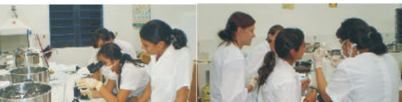
Habilitación del laboratorio de química con nuevos equipamientos.

En el marco de la enseñanza de la Química y Física se requiere de las prácticas de laboratorio a fin de que el estudiante adquiera por sí mismo nuevos conocimientos y habilidades que les serán útiles en su futuro trabajo profesional, es así que con mucho entusiasmo y actitud científica se han iniciado las prácticas en el laboratorio de nuestra facultad otorgando a los jóvenes la oportunidad de incrementar sus capacidades para resolver problemas prácticos, mayor independencia, análisis, planeamiento del experimento y la interpretación de los resultados experimentales.