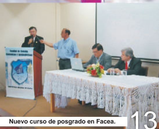
Nuevo curso de posgrado en Facea.