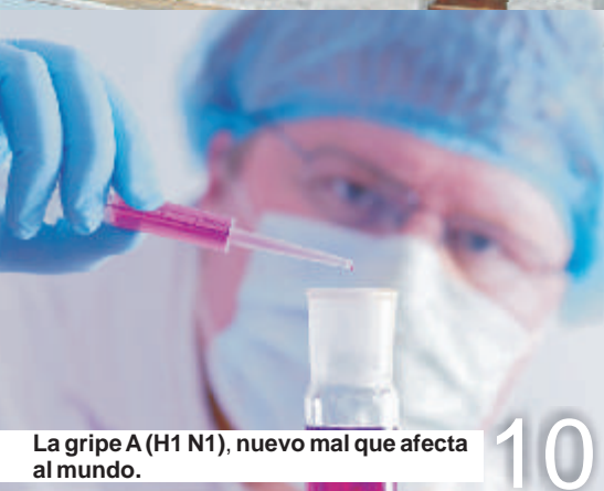
La gripe A (H1 N1), nuevo mal que afecta al mundo.