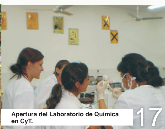
Apertura del Laboratorio de Química en CyT.

Este trabajo que propone la UNI, el de comunicarnos con usted, nos compromete cada vez más a llegarle con la responsabilidad los datos que avalan el cumplimiento de la razón universitaria: educar, investigar y extender el conocimiento producido por nuestros actores.