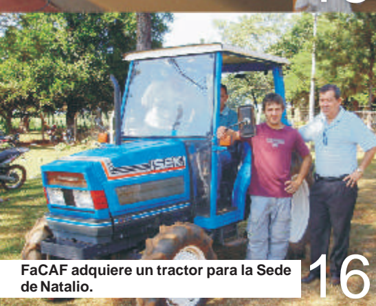
FaCAF adquiere un tractor para la Sede de Natalio.