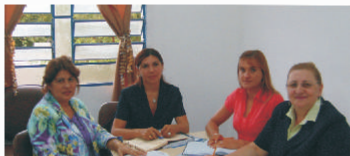
Integrantes de la Comisión Central en Sesión de Trabajo

Cumplido el proceso de Autoevaluación, se remite a la ANEAES los informes mencionados acompañados de la solicitud de Acreditación.