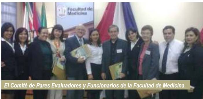
El Comité de Pares Evaluadores y Funcionarios de la Facultad de Medicina.