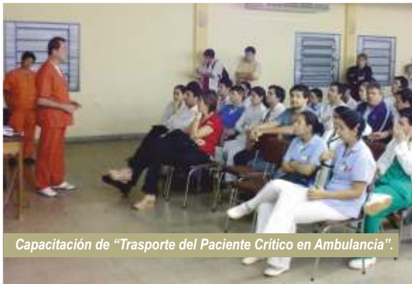
Capacitación de "Trasporte del Paciente Crítico en Ambulancia".

Ambulancia", a cargo del área de Transporte del Hospital Dr. Ramón Madariaga de la Ciudad de Posadas, República Argentina, la cual se llevó a cabo el 11 de mayo, en el Salón Auditorio del Hospital Regional de Encarnación.