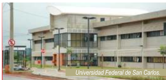
Universidad Federal de San Carlos.