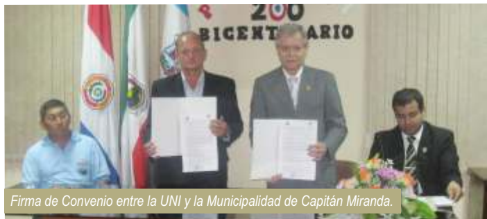
Firma de Convenio entre la UNI y la Municipalidad de Capitán Miranda.