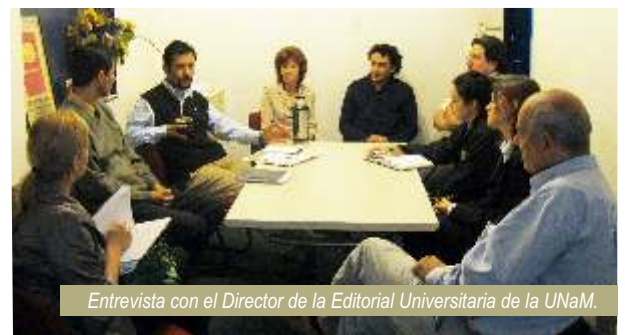
Entrevista con el Director de la Editorial Universitaria de la UNaM.

comitiva de la UNI y explicó sobre los objetivos y logros de su entidad, empresa sin fines de lucro, creada en 1992 con la finalidad de publicar la producción docente y académica y lo más selecto de la literatura regional de la vecina ciudad.