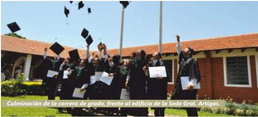
Culminación de la carrera de grado, frente al edificio de la Sede Gral. Artigas.