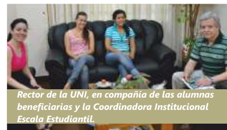
Rector de la UNI, en compañía de las alumnas beneficiarias y la Coordinadora Institucional Escala Estudiantil.

acompañamiento permanente y la gran oportunidad.