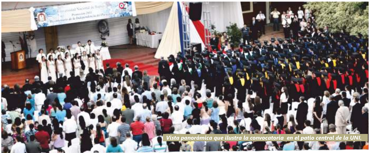
Vista panorámica que ilustra la convocatoria en el patio central de la UNI.

Celebrada el 20 de diciembre, en la explanada del Campus de Encarnación de la Universidad Nacional de Itapúa (UNI), la novena ceremonia de graduación "Bicentenario de la Independencia del Paraguay", presentó a 237 nuevos profesionales en las áreas de Ingeniería Electromecánica, Ingeniería Civil, Ingeniería en Informática, Medicina, Ingeniería Comercial, Licenciatura en Administración, en Contabilidad, Licenciaturas en Bilingüismo Guaraní-Castellano, Ciencias Sociales, Psicología, Ciencias Jurídicas. Por primera vez, este año egresaron profesionales de la Facultad de