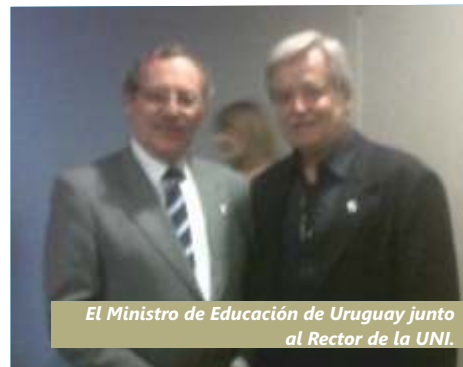
El Ministro de Educación de Uruguay junto al Rector de la UNI.

En el marco de conmemoración de los 20° Aniversario de la Asociación de Universidades del Grupo Montevideo (AUGM), se realizó el II Seminario Internacional Universidad-Sociedad-Estado, del 16 al 18 de noviembre en el Salón del Mercosur de la Ciudad de Montevideo, Uruguay.