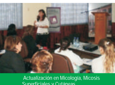
Actualización en Micología, Micosis Superficiales y Cutáneas.

E l departamento de Docencia, Investigación y Extensión Universitaria de la Facultad de Medicina de la UNI, conjuntamente con los Programas de Diabetes e Hipertensión Arterial de la Séptima Región Sanitaria (MSP y BS), han realizado el viernes 17 de Abril en la Ciudad de Hohenau, charlas educativas y atención primaria en la Casa de la Cultura de esa ciudad. Esta jornada contó con numerosos asistentes que fueron beneficiados con dicha actividad.