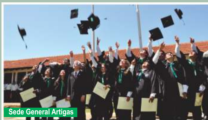
Sede General Artigas