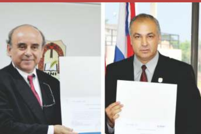
ANEAES acredita a Ingeniería Civil y Derecho Pág. 8