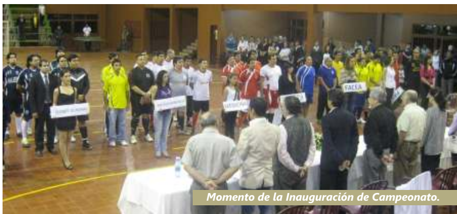
Momento de la Inauguración de Campeonato.