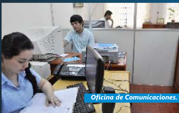
Oficina de Comunicaciones.

En 1.999, desde la Secretaría Privada del Rectorado la comunicación hizo sus primeros pasos. Desde entonces, se editaron boletines de noticias, trípticos y anuarios. A partir del 2003 nace el Departamento de Comunicaciones con la producción de las primeras revistas informativas y otras publicaciones.