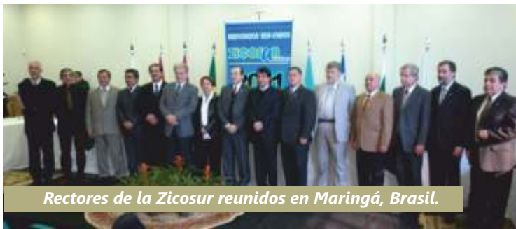
Rectores de la Zicosur reunidos en Maringá, Brasil.