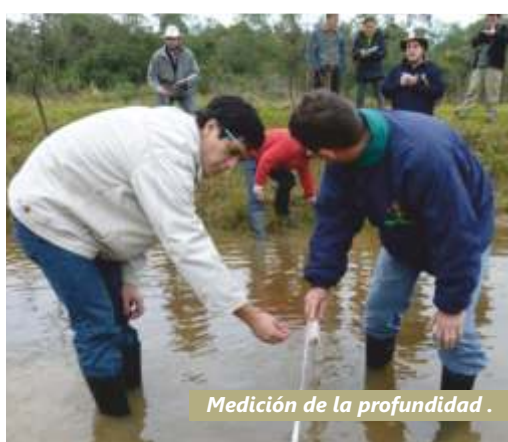
Medición de la profundidad.