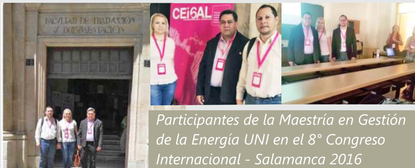
Participantes de la Maestría en Gestión de la Energía UNI en el 8° Congreso Internacional - Salamanca 2016

Representantes de la Maestría en Gestión de la Energía de la UNI, participaron del VIII Congreso Internacional del Consejo Europeo de Investigaciones Sociales de América Latina (CEISAL) desarrollado en la Universidad de Salamanca, España, del 28 de junio al 1 de julio, edición que se celebró bajo el lema "Tiempos poshegemónicos: sociedad, cultura y política en América Latina".