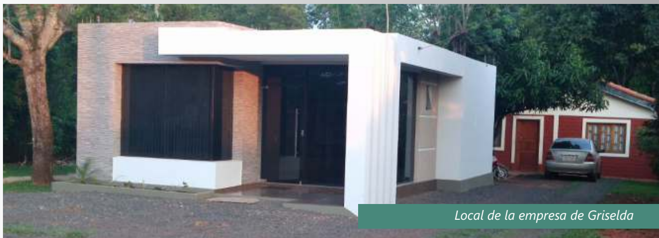
Local de la empresa de Griselda