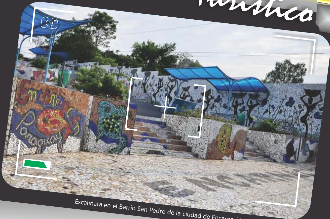
Escalinata en el Barrio San Pedro de la ciudad de Encarnación.

04 CONACYT entrega desembolso para financiar Maestría en Biotecnología de Alimentos