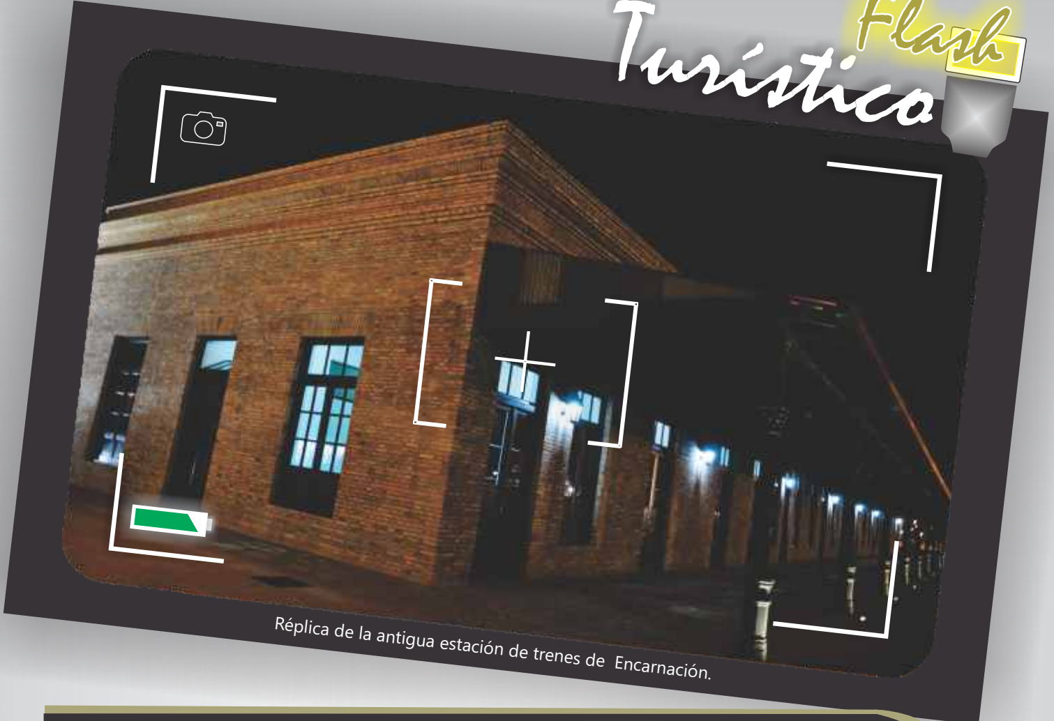
Réplica de la antigua estación de trenes de Encarnación.